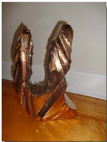
Thérèse Thibodeau Paquin

Ouvert au public les samedi et dimanche, 11:00 h. à 17:00 h