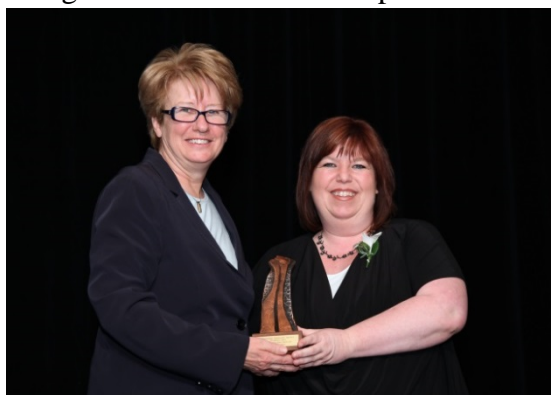
Centre d'action bénévole des Riverains

communauté ainsi que l'action d'organismes en vue de promouvoir et favoriser l'essor de l'engagement bénévole. Nous tenons à remercier aujourd'hui tous nos partenaires et bénévoles. Vous êtes partie prenante de l'équipe du CAB des Riverains et sans votre apport, nous n'aurions jamais pu recevoir un prix aussi prestigieux. MERCI!